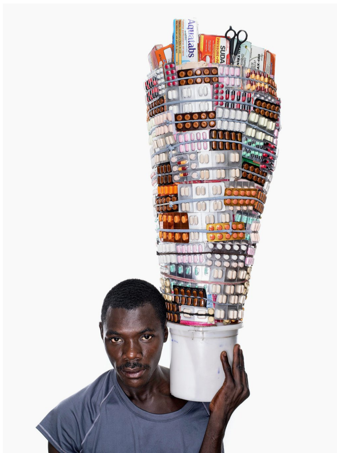
Antibiotika, Schmerzmittel, Antibabypillen: Der Medikamentenverkauf auf den Strassen Haitis ist eigentlich illegal, aber es mangelt an Alternativen.

Bei ihrer mehrjährigen Recherche trafen der Fotograf und der Journalist auf nigerianische Farmarbeiter, die Schmerzmittel nehmen, um ihre Arbeitstage zu verlängern, auf Teenager, die sich mit ADHS diagnostizieren lassen, um leistungssteigernde Medikamente zu erhalten, oder auf Krebspatienten, die sich für einen assistierten Suizid durch die Einnahme von Pentobarbital entscheiden. Unter dem Titel «Happy Pills» gibt es diese Geschichten inzwischen als Buch, Film und als Fotoausstellung, die in den kommenden vier Wochen im Rahmen des